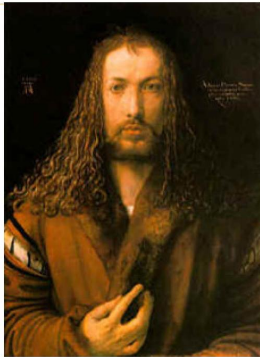
Dürero a los 28 años

La mayoría de los autorretratos del pasado suelen mostrar la cabeza o el busto, pero la fabricación industrial de grandes espejos en los que el artista podía contemplarse de cuerpo entero contribuyó a darle a estas pinturas una mayor majestuosidad y complejidad, tal como puede apreciarse en el Autorretrato de Goya que aparece abajo.